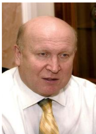
Il governatore di Nizhny Novgorod Valery Shantsev

Alcuni colossi come Ikea, Iveco e Wella sono già arrivati. Altri si stanno affacciando solo ora. Considerata una delle zone più sviluppate della Russia, la regione di Nizhny Novgorod negli ultimi anni è diventata una forte calamita per quegli investitori che puntano a Est. Intrattiene rapporti commerciali con oltre 125 Paesi in tutto il mondo e ormai da tempo, grazie alla crescita di settori legati al legname, al chimico e ai macchinari industriali, fa gola a businessmen russi e stranieri. A raccontare le potenzialità di questa regione, situata nella Russia Europea Centrale, con un prodotto regionale lordo in aumento annuo del 107-108 per cento, ci ha pensato il governatore locale, Valery Shantsev.